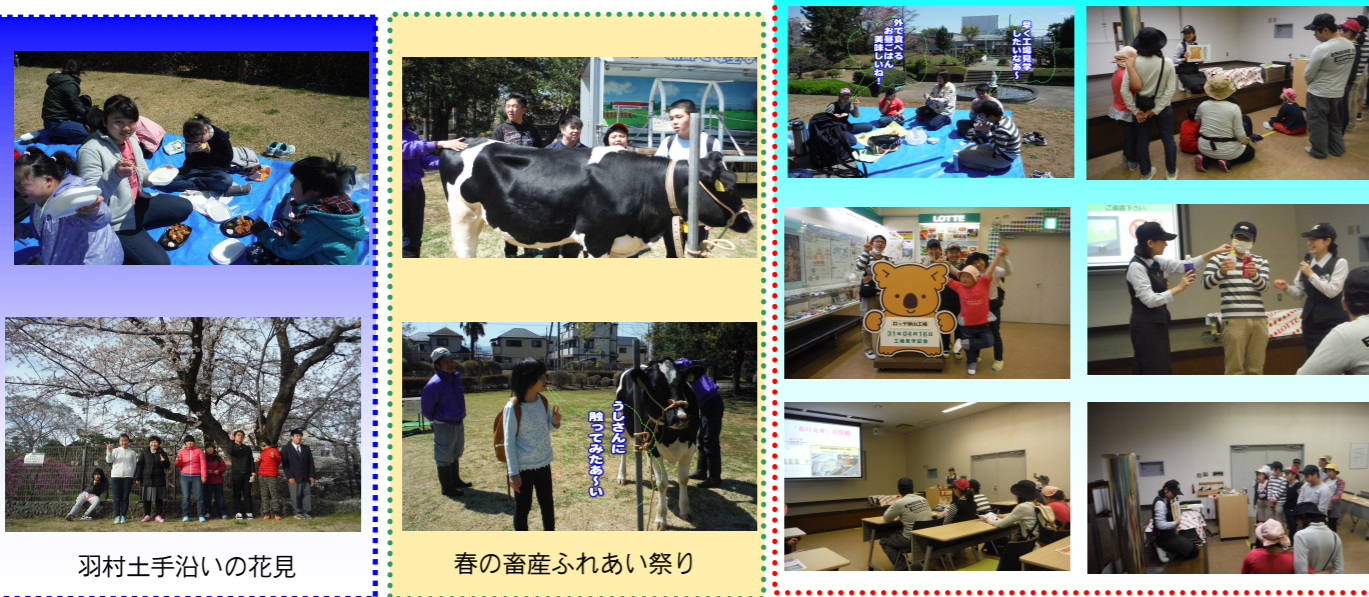
羽村土手治いの花見

4月3日羽村土手治いの花見、4月13日畜産試験場の「春の家畜ふれあい祭り」参加、4月16日「ロッテ狭山工場見学」の写真です。