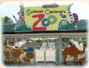
埼玉こども自然動物公園

みんなで動物園へ行きました！！皆さん動物達をスタッフと一緒にのんびりと見て回り楽しそうでした！！そして乗馬体験もしました！！