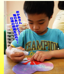
母の日プレゼント工作