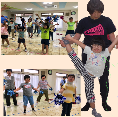
先生！私からだ、褒めたいです！