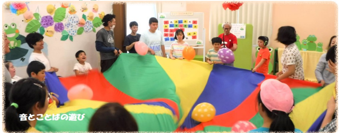
音とことぼの遊び

みなさんこんにちは。今号の通信ひかるは「平成最後の3月、4月の各事業所の活動」と「令和になっての各事業所の活動、各事業所の職員紹介」を取り上げてみました。元号が変わり令和元年度がスタートしました。令和元年も引き続き「通信ひかる」の発行を行います。発行に必須の写真、投稿文のご協力をお願い致します。編集員：鈴木