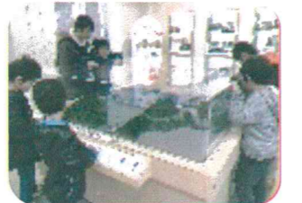
<奥多摩湖：展望塔にて>