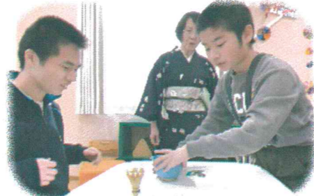
<茶道教室の一コマ>