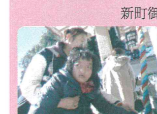
新町御嶽神社へ初詣