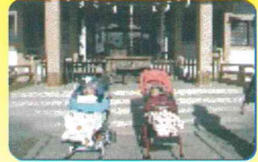
新町御嶽神社へ初詣

1月初旬に新町御嶽神社に初詣に行きました。本坪鈴を鳴らして、しっかりお参りました。「今年もみんな元気で良い年になりますように」