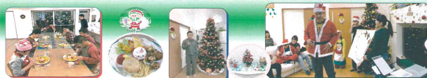
みんなで楽しく食事会

12月はクリスマス会を行いました。毎年大きなツリーで皆さん大喜び!ゲストを招いた音楽会を楽しみ、豪華なお食事にも大満足でした。!