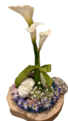
ぶれありびんぐ 「ひな祭りバージョン」 フラワーアレンジメント