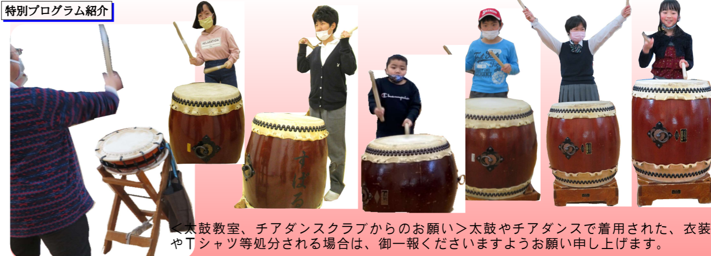
特別プログラム紹介

現在、コロナ感染対策で密を避けるために、先生指導の練習は事業所単位(らんらんすばる、ありえす)の隔週で実施しています。先生が来所しない週は、先生の画像を見ながらプロジェクターを使用したチアダンスの練習を行っています。みんな集中して踊っています。