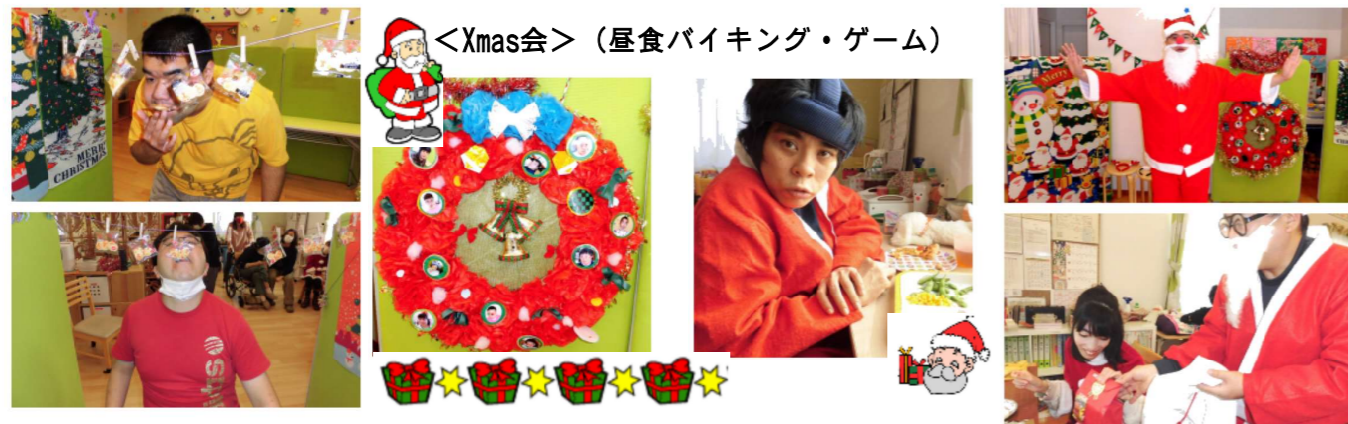
<Xmas会> (昼食バイキング・ゲーム)

「音楽療法Xmas会バージョン」「バイキング」「5種ゲーム大会」とクリスマスモード色☆多手作りの巨大リースを囲んで絶品ピザやゲームで盛り上がりお茶目なサンタからのプレゼントで笑顔一杯の一日となりました★