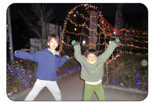
イルミネーション見学