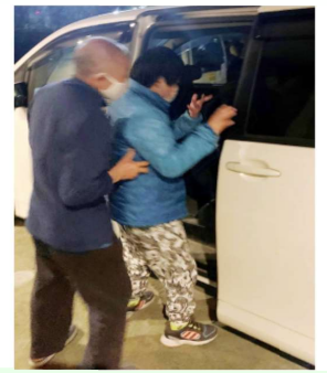
室内から乗車して避難訓練する訓練の様子