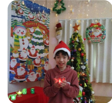
キャンドルサービスの様子