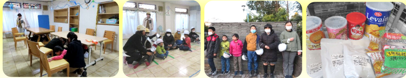
事業所内防災訓練の様子