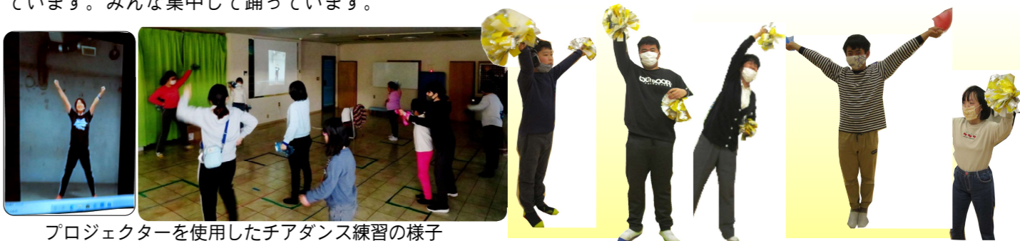
プロジェクターを使用したチアダンス練習の様子 <音楽療法> ぶれありびんぐ Xmasバージョン

現在、コロナ感染対策で密を避けるために、先生指導の練習は事業所単位(らんらんすばる、ありえす)の隔週で実施しています。先生が来所しない週は、先生の画像を見ながらプロジェクターを使用したチアダンスの練習を行っています。みんな集中して踊っています。