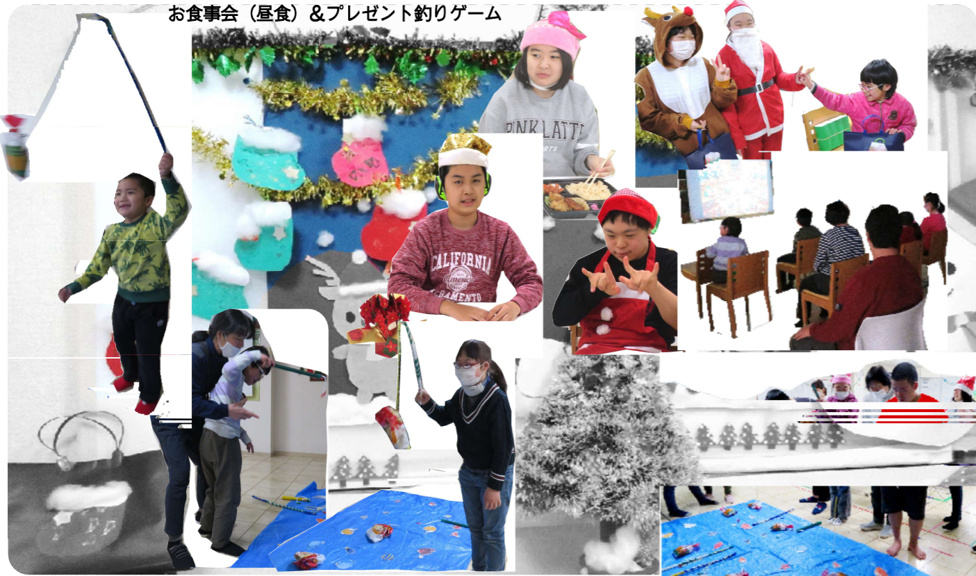
お食事会 (昼食) & プレゼント釣りゲーム

<室内活動>ワーク 歩行後、おやつを食べてからの短い時間に、クリスマス制作やボールペン組立、紐通し、パズル等のワークに取り組んで頑張っています。