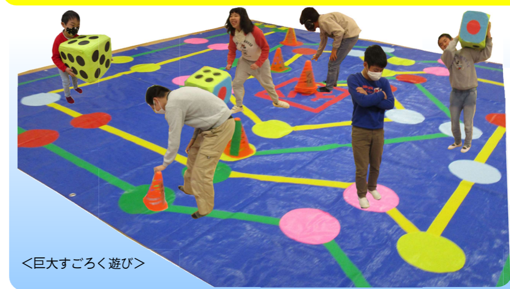
<巨大すぐろく遊び>