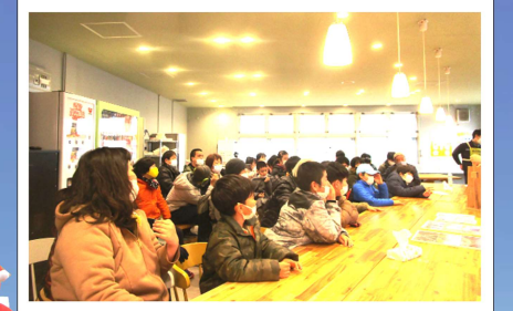
ありえず：工場見学