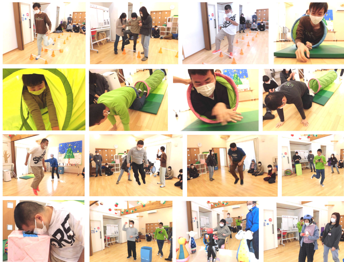
<新年お楽しみ会：サーキット・縄跳び・的あて>

新年1月4日、元気いっぱい全員通所、新年顔合わせ会として「お楽しみ会」を開催しました。お正月太りを解消?できるように、たくさん身体を動かして、張り切って1年のスタートを切りました。サーキットでは狭い輪をくぐり抜け、的当てでは点数を競い合い、大縄飛びでは見事な跳躍を見せてくれました!ゲームの後には大好きな「お菓子つかみ取り」のお楽しみが待っているので、みんな手を動かさずに頑張りましたよ~☆2022年、今年こそはたくさん外出して思い出の多い1年にと願わずにはいられませんでした。