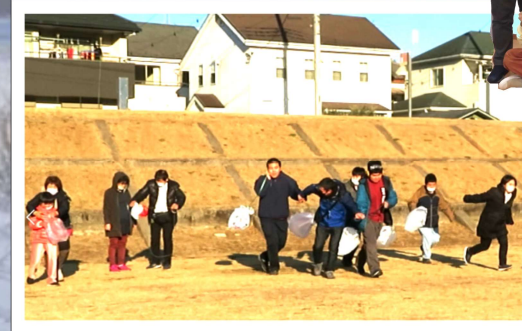
らんらん：手造り凧揚げ