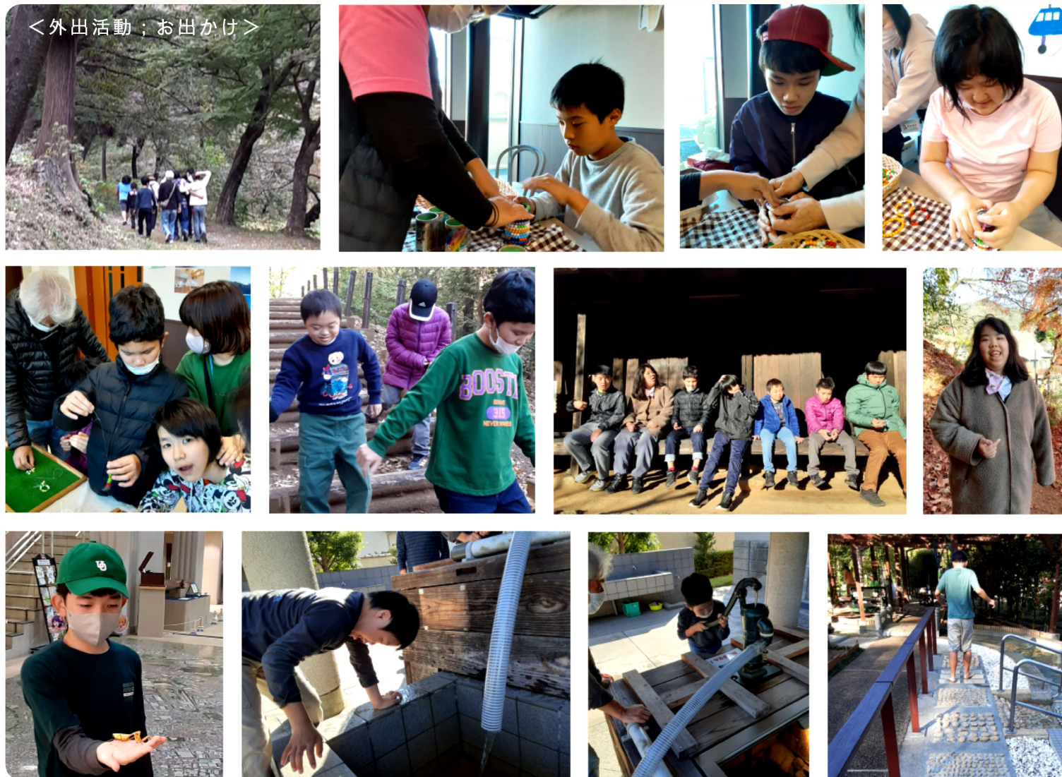
<外出活動；お出かけ>

土曜日定番の「はらべこ青虫」の絵本読み聞かせ。日ごとに装飾が多くなり、とても賑やか絵本読み聞かせの時間になっています。子ども達も自発的に絵本の周りに集まり、活動に参加していますよ♪グループ学習では色々な形を使ったスタンプを行いました。この形でスタンプするとどんな風になるのかな？と考えながら真剣に取り組んでいましたよ♪これからもこれがどうなるんだろうというワクワクする気持ちを大切に、活動に取り組んでいきたいと思ひます。