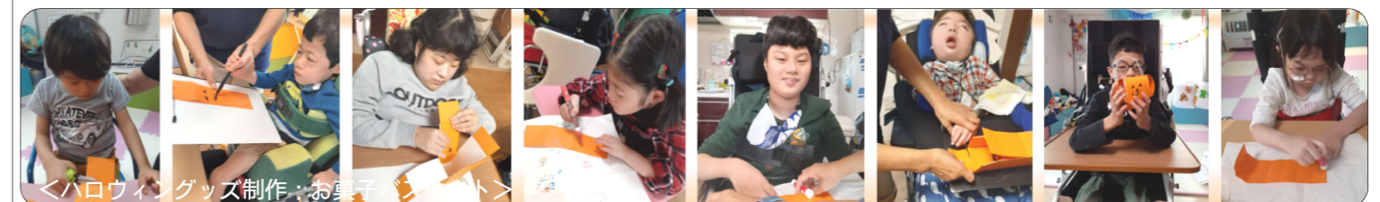
<ハロウィングッズ制作：お菓子作り>