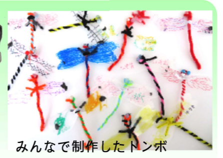
みんなで制作したトンボ