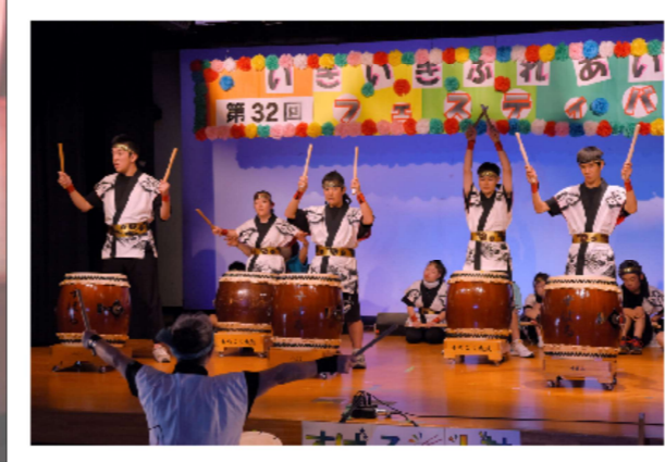
2023いぎいぎふれあいフェスティバル

<理事長あいさつ>9月後半になり、朝晩涼しさを感じられ、秋めいてまいりました。コロナ禍で数年間中止されていた、お祭やイベントが開催されるようになりました。地域社会での参加体験を通して学べる療育として、放課後等デイサービスの利用者様、また、社会人の方々もお誘いし、各イベントに参加する事ができました。舞台発表する事で、地域社会の方々とも触れ合い、すばるの活動を皆様にご理解を頂き、称賛の声を沢山頂きました。また、ご利用者様もイベントに参加する度に成長された姿が見られ、保護者様から喜びの声を頂きました。すばるでは、各事業所、これからも一人一人を大切に思い、努力を重ねてまいりたいと思います。