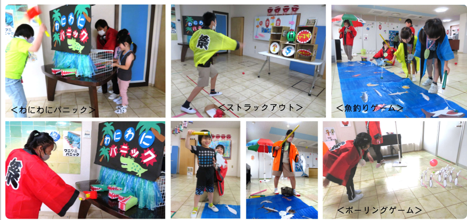
<わにわにパニック>

今年もまたらんらの夏祭りを開催しました。わにわにパニック、ストラックアウト、魚釣り、ボーリング、積み上げゲーム、みんなそれぞれに好きなゲームに向かって、楽しめるようになっていました。「ここに向かって投げるんだよ」「こうやって釣るんだよ」と職員に教えてくれたり、魚釣り名人は大漁を喜んでニコニコ笑顔、わにわにパニックでは叩く方も真剣そのもので目を離さず、今年はワニ役にも人気が出て「やりたい、やりたい」!支援員も一緒に楽しい夏まつりを過ごすことが出来ました。