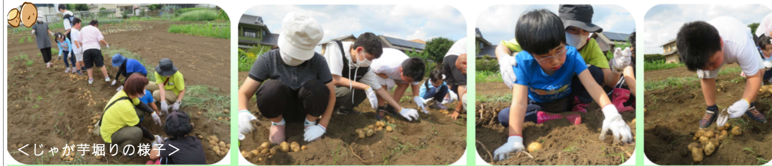
<じゃが芋掘りの様子>