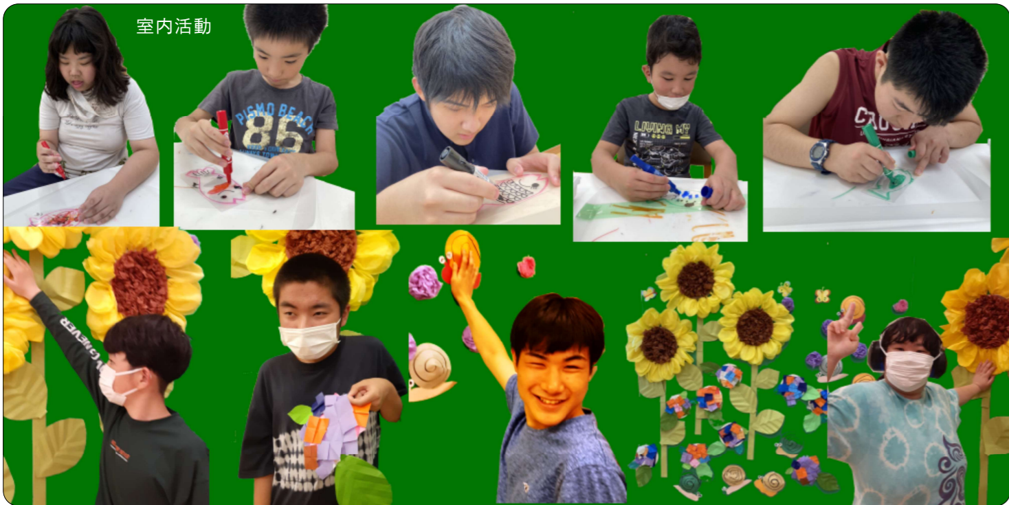
はらぺこあおむし