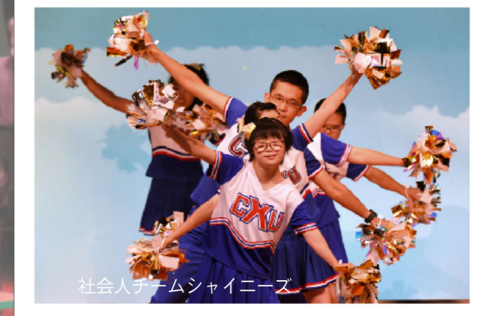
社会人チームシャイニーズ