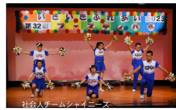
社会人チームシャイニーズ