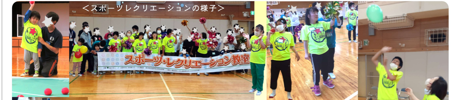
<スポーツレクリエーションの様子>

春に種芋を植えて、6月にはじゃが芋掘りを体験しました。「どこどこ?」「ここにも、ここにも」「あつたーあつたー」とはしゃぎながら、おおきなお芋や可愛い小粒の芋など沢山掘ることが出来て暑さも忘れる瞬間で、作業も真剣に取り組楽しそうでした。いつも食卓に並ぶお芋やみんなの大好きなポテトはこのお芋から作るんだよと話す「大好き、大好きー食べたーい」とワクワクしていました。