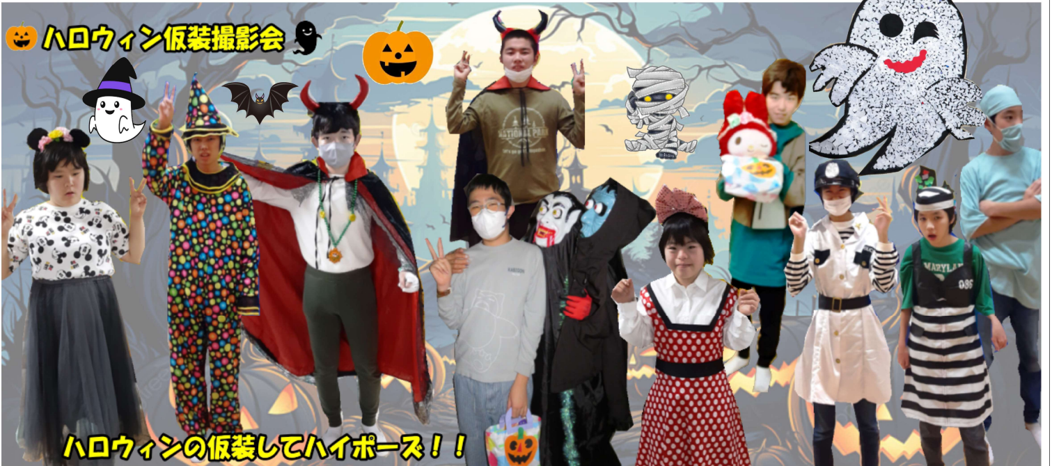
🎃 ハロウィン仮装撮影会 🎃