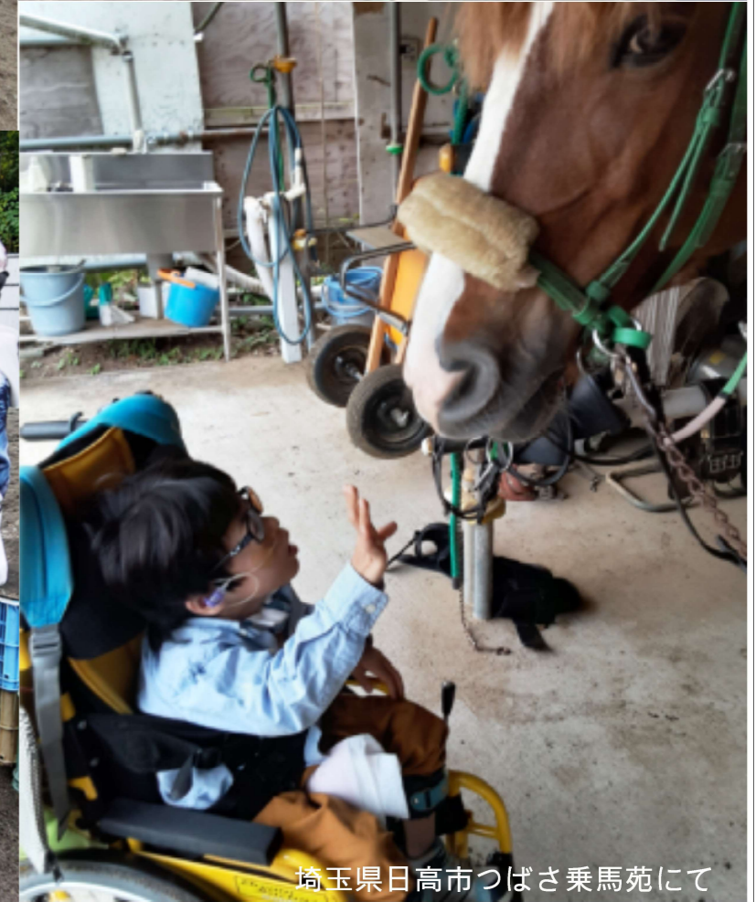
埼玉県日高市つばさ乗馬苑にて