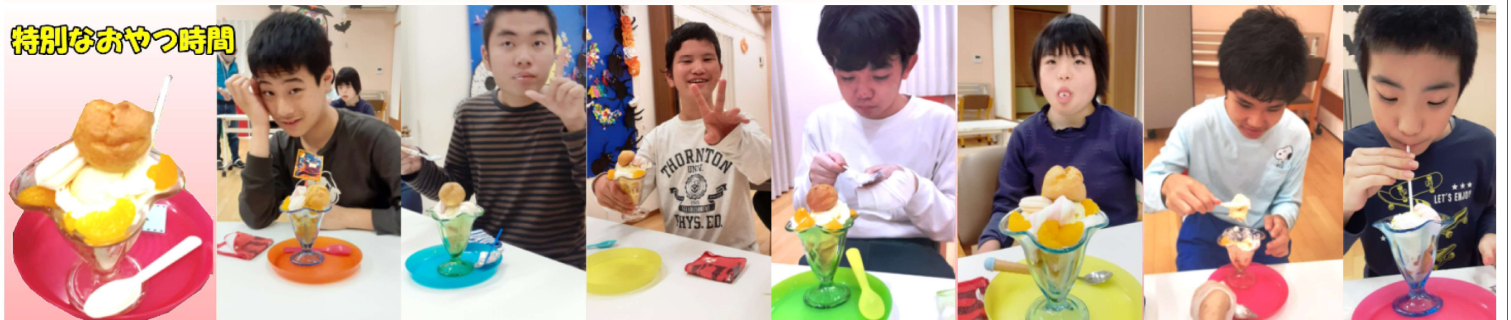
特別なおやつ時間

今日は特別なおやつです♪食べ方はいろいろ！みんな幸せそうに食べています。写真のポーズもばっちり決まっていますね。