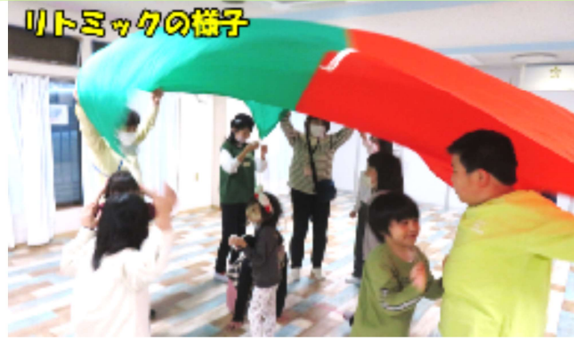
リトミックの様子

集団で行うパラバルーンでは、みんなの協力が必要で同じ方向に進みながらバルーンを広げて紐を持ち「上げて下げて」とタイミングを計りドーム型になったら中に入ります。みんなその瞬間がワクワクするようです。