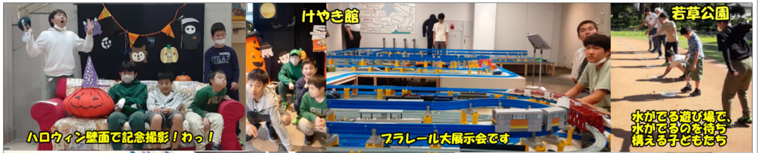
ハロウィン壁面で記念撮影！わっ！