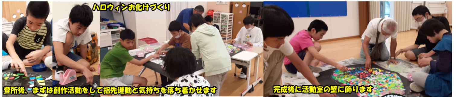
ハロウィンお化けづくり

明星大学跡地にある航空学園の学園祭にってきました。1時間程度で次のお出かけ先に行く予定でしたが、結局2時間半以上遊びました。CA体験ができる模擬機体はとても大きく、脱出用の滑り台や機体内のシートも本物でした。