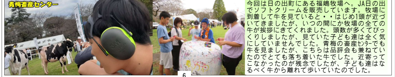
青梅畜産センター

今回は日の出町にある福嶋牧場へ。JA日の出でソフトクリームを販売しています。牧場に到着して牛を見ていると・・・はじめ1頭が近づいてきましたが、いつの間にか牧場の全ての牛が挨拶にきてくれました。頭数が多くてびっくりしましたが、見ていた子ども達は全く気にしていませんでした。青梅の畜産センターでも牛を見ましたが、こちらは品評会も兼ねていたのでとても落ち着いた牛でした。近寄ってこなかったのが残念でしたが、子ども達はなるべく牛から離れて歩いていたのでした。