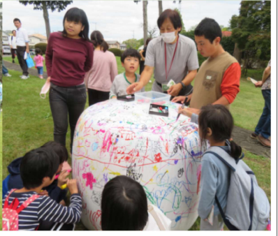
五十鈴中央株式会社 青梅サービスセンター見学の様子