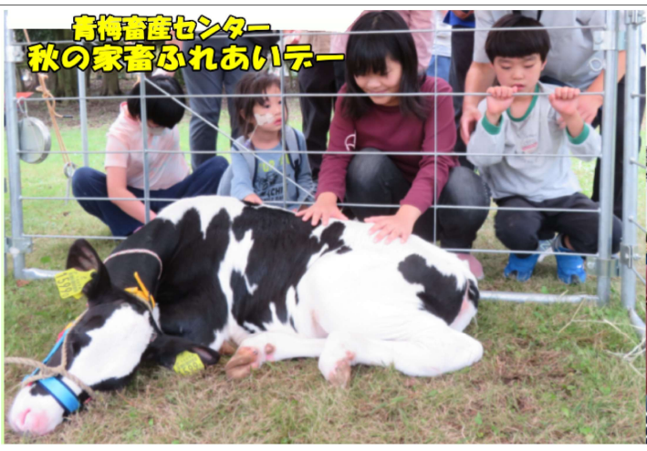
青梅畜産センター 秋の家畜ふれあいデー

10月19日（土）に青梅畜産センターで開催された、秋の家畜ふれあいデーに行ってきました。農畜産物の販売や子牛とのふれあい・料理教室など、盛りだくさんのイベントが開催されていました。目の前で子牛に触れてみんなの優しい気持ちが伝わったようで、子牛も気持ちを許してくれたようですね・・・。