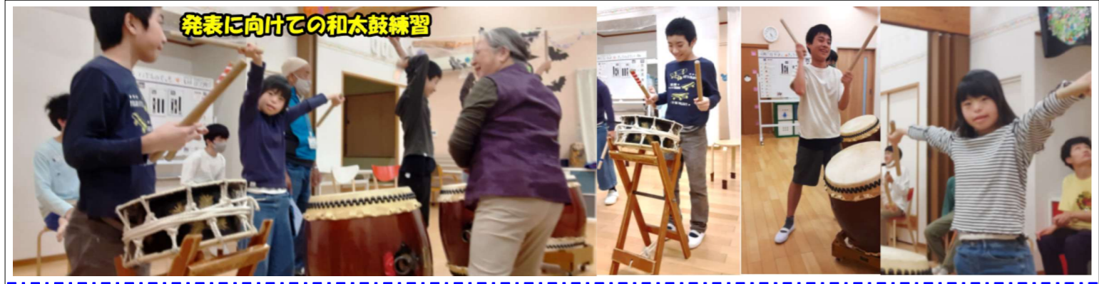
発表に向けての和太鼓練習

とても暑いなかでの発表でしたが、子ども達は叩く気持ちは気温以上に熱く、大勢のお客さんの前でとてもよい響きを皆様に届けることができました。一生懸命太鼓を叩くのに力を注いだので、集合写真の時には既にやりきった表情をみせていました。