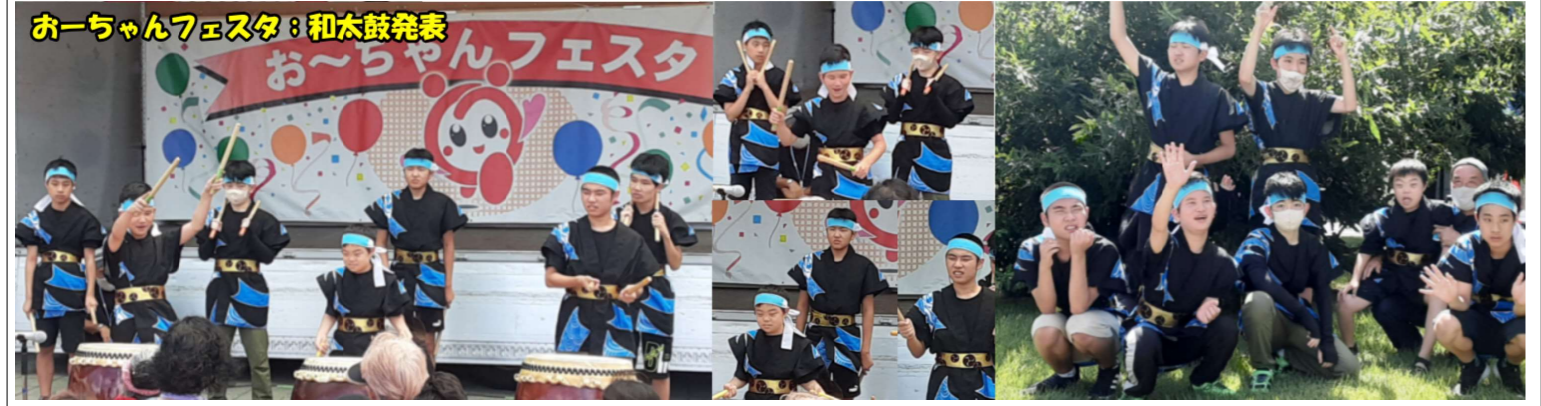
お〜ちゃんフェスタ：和太鼓発表

とても暑いなかでの発表でしたが、子ども達は叩く気持ちは気温以上に熱く、大勢のお客さんの前でとてもよい響きを皆様に届けることができました。一生懸命太鼓を叩くのに力を注いだので、集合写真の時には既にやりきった表情をみせていました。