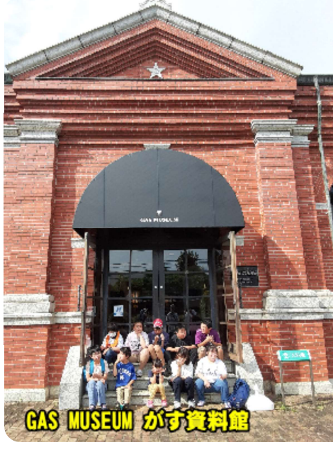
GAS MUSEUM がす資料館

東京都小平市の新青梅街道沿いにある東京ガスの作った都市ガスの資料が展示されている博物館に行ってきました。初めてのガス灯をはじめガス機器の歴史が分かり、当たり前に使っているガスのことが子供たちにも勉強になる良い資料館でした。