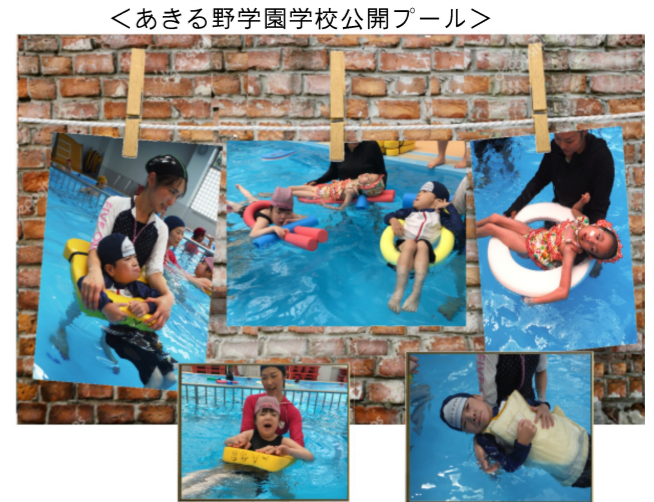
＜あきる野学園学校公開プール＞