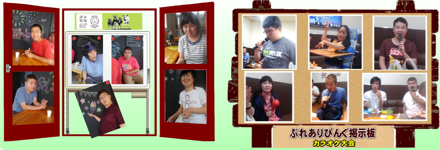
ぶれありびんぐ 掲示板 カラオケ大会

今年は猛暑続きで厳しい夏でしたね。夏季休暇のない生活介護ではお仕事づくしの毎日で本当に大変でした。そんな中ほっと一息の工房やカラオケ・足湯は最高のご褒美でした。もっともっとお仕事頑張ります。