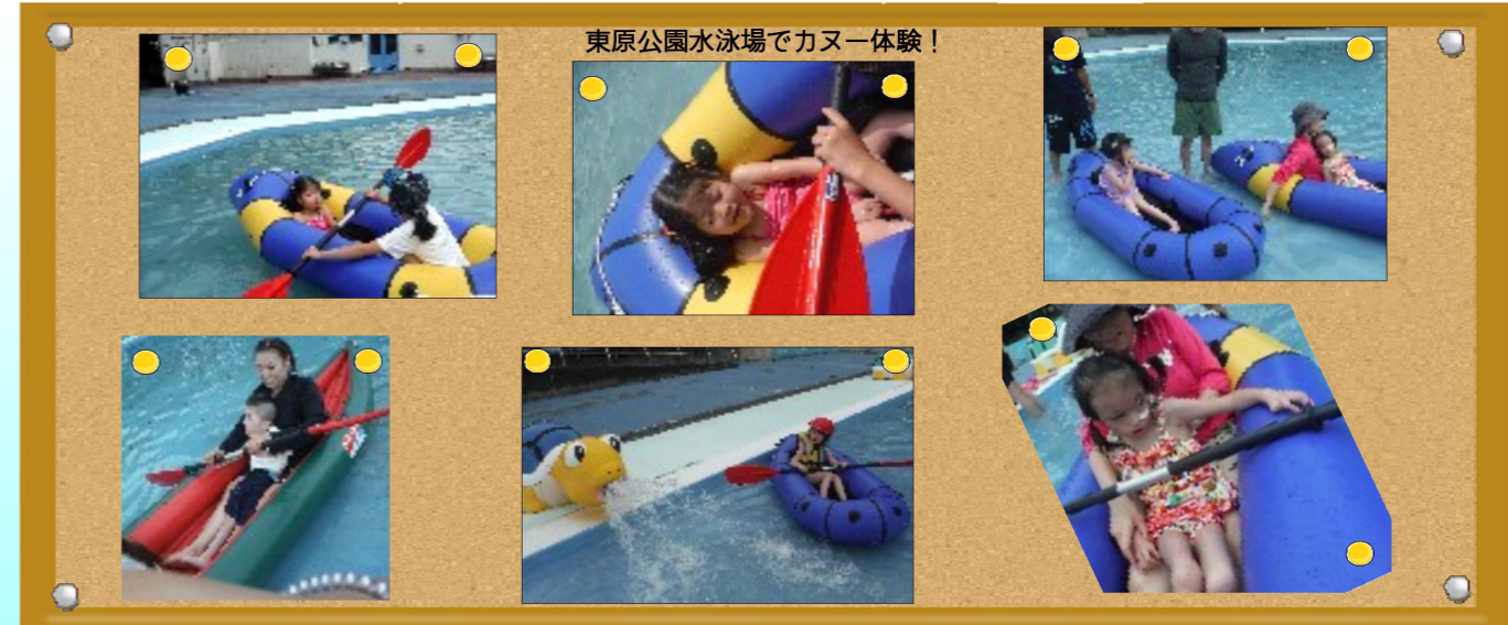
東原公園水泳場でカヌー体験！