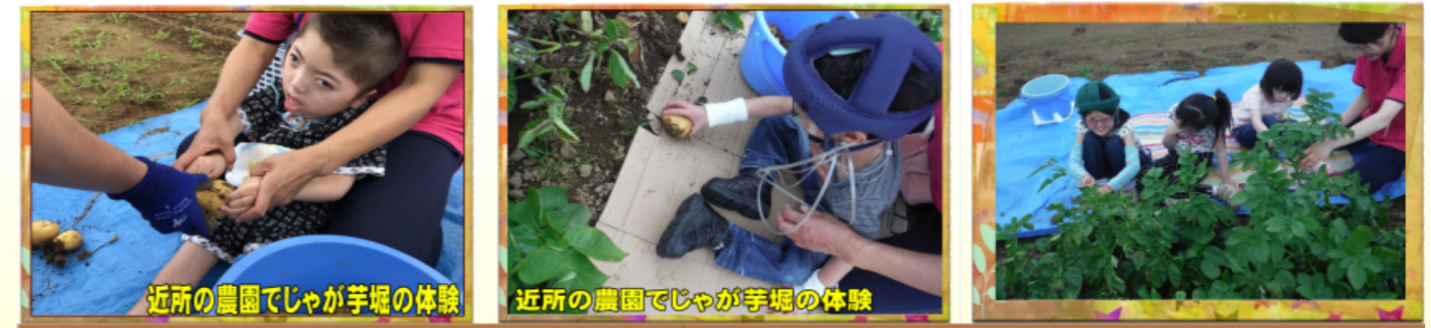
近所の農園でじゃが芋掘りの体験

6,7,8月と梅雨のジメジメや夏の暑さにも負けずにみなさん元気に登所していただきました。「じゃが芋掘り」「あきる野学園プール」「縁日」「カヌー体験」など、体験をしていただきました。季節の制作もみなさん頑張って作成しています。これからも楽しんで登所していただけるようスタッフ一同頑張ります！！